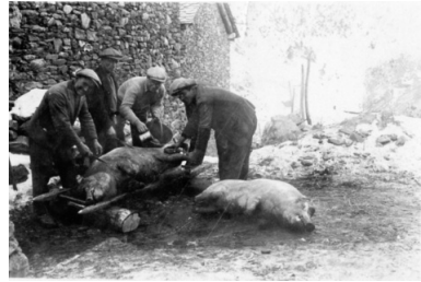
Matança del porc. Fons de casa Jarca. Arxiu del Comú de Canillo

menjaven al bar. Es bevia, es cantava i es ballava. D'altres jugaven a cartes. Era una nit de festa. A partir de la dècada dels anys 60 del segle XX en algunes cases la mainada feia cagar el tió i es picaven els troncs encesos. El dia de Nadal se celebrava la tradicional missa cantada, el dinar de família i es feia ball de tarda i de nit. També s'organitzava ball pel dia de Sant Esteve. El 27 de desembre, dia de Sant Joan, se celebrava una missa matinal a Sant Joan de Caselles i a la sortida un jove es vestia de garba i empaïtava tothom pel camí de Sant Joan de Caselles a Canillo. El 28, dia dels Sants Innocents, es feien bromes a la gent, en concret fer-los anar d'un lloc a l'altre per no-res. La nit de Reis es posava un plat a la finestra de les cases amb un got de moscatell per als Reis i una mica de mescla (barreja d'herba i palla per al bestiar). L'endemà els reis havien portat coca, fruita, galetes, bombons, caramels i a les cases més adinerades, unes monedes, res de joguines ni roba. Les bicicletes no van aparèixer fins als primers anys de la dècada dels anys 50 del segle XX. Darrerament es rep el Pare Noel en una rua pels carrers del poble de Canillo, es continua celebrant la missa del gall i s'ofereix xocolata i vi bullit a la sortida, i es fa una cavalcada de Reis al poble de Canillo el dia 5 de gener.