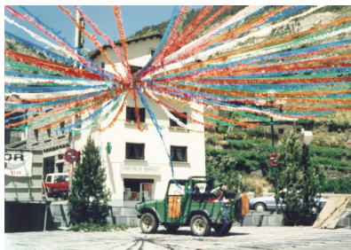
Festa major a la plaça Major de Canillo, juliol 1988.

saxo, acompanyats de l'Estevet Sastre o l'Estevet Roncaire. El primer dia, el 25 de juliol, es deia una missa a Sant Jaume de Ransol acompanyada dels músics. A la sortida els músics també acompanyaven la comitiva, formada pel mossèn, les autoritats i la resta dels veïns fins a cal Pirot, on es feia un aperitiu. Es dinava i després a la tarda hi havia ball i després de sopar, als Plans, ball de nit. El dia 26 de juliol la festa començava a les 12 del migdia amb un ball a la plaça de Ransol. Després s'anava a fer una beguda (coca, xocolata, moscatell) a la font de Ferro, i després pel camí del Jovell s'anava cap a l'Aldosa a dinar, sempre acompanyats dels músics, que dinaven repartits per les cases. A la tarda es feia el ball de les cuineres dins de cada casa. Després es tornava a Ransol per fer el ball de tarda i després de sopar, el ball de nit. Durant el ball de nit es passava la toia (sorteig d'una vaixella) per recaptar diners, i no hi podien faltar el ball de rams i el ball del fanalet.