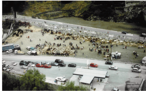
Vista aèria de la Fira de Canillo al prat del Som, anys 90.

La fira de Canillo. Als anys 30 del segle XX ja se celebrava la fira de Canillo. Totes les cases posaven a la venda el millor bestiar de tir o de carn que era comprat per les principals cases del país. La fira inicialment se celebrava a la plaça de davant de ca l'Agustí el 16 d'octubre. De forma recent se celebra el tercer diumenge d'octubre i en llocs diferents com el Prat del Riu, el Camp de Som o a l'aparcament de la urbanització Els Refugis.