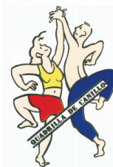
Logotip de la Quadrilla de Canillo, creat per Raimon Florensa el 1988