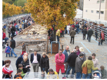
Fira de Canillo al prat del Riu, 19 d'octubre del 2008.

La Fira del bestiar es duia a terme a Canillo durant el mes d'octubre, quan s'havia acabat d'engreixar i es baixava el bestiar de la muntanya. Per a moltes famílies era el moment d'obtenir ingressos econòmics a partir de la venda de bestiar de pèl i de llana, i també el moment d'aparaular futurs tractes o acords. La fira era i és un punt de trobada per la gent de la parròquia i del país en general. Avui, tot i que l'activitat ramadera ha disminuït en gran mesura, la Fira del bestiar i de les tradicions encara manté aquest mateix esperit d'encontre i recorda el pes que l'activitat ramadera havia tingut a la parròquia de Canillo i a Andorra en general.