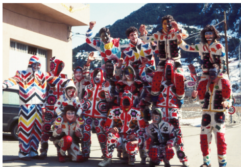
Colla dels arlequins de Canillo els anys 80.