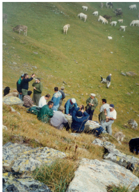
La vacada de Canillo pujant el Port Dret, 1999.

Meritxell i Prats: 8 de setembre. La festa major dels pobles de Meritxell i Prats coincideix amb la festa nacional de Meritxell. A Meritxell, durant la vetlla, es fa una processó amb fanalets i després una missa. Des de fa uns vint anys s'inaugura una exposició i des de fa dos anys un ball de nit amenitzat per una orquestra. Abans, durant el dia de Meritxell, al matí pujaven molts venedors de la comarca de l'Alt Urgell. Portaven cistells amb figues, raïm, pomes i altra fruita per vendre i se situaven al camí dels Esquirolets, prop del santuari. Per aquest motiu