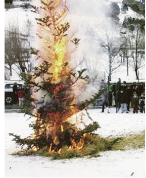
Crema del Mai al prat del Som, gener 1999.