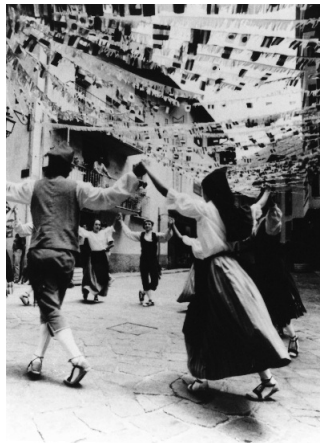
Festa major de Canillo els anys 50.

Fins fa uns 150 anys la festa major de Canillo se celebrava per Sant Serni, el 29 de novembre, però es va deixar de celebrar en aquesta data perquè coincidia amb la fira d'Organyà, una de les fires de bestiar de peu rodó més importants de Catalunya i d'obligada assistència per als caps de casa de la parròquia de Canillo. Un altre motiu era que els fadrins i fadrines marxaven a treballar a França durant la tardor i l'hivern; finalment, també perquè el temps no era gaire propici per dur a terme festes al carrer. Hi ha qui ha sentit explicar que s'havia de treure la neu de la plaça per poder celebrar la festa major. La plaça de Canillo es trobava en aquells moments entre cal Roc i l'era de cal Francès però desaparegué amb la construcció de la carretera, l'any 1933. El treball de guarniment de la plaça es donava a subhasta; consistia a posar-hi boixos als voltants i s'hi