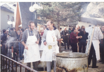
Vianda de Sant Antoni a la plaça de Montaup, gener 1993.

Els encants i la vianda de Sant Antoni. Durant el mes de gener el sagristà de la parròquia passava per les cases de Canillo i els veïnats a deixar una imatge de sant Antoni del porquet, patró dels animals. Els amos deien un parenostre al sant perquè protegís els seus animals i bestiar. La mestressa ficava un brotet de marduix dintre de la capelleta i després donaven alguna cosa per als encants: embotits, botifarra, peus, cap i orelles de porc salades, un sarró de blat o pa artesà. El dia 17 de gener, diada de Sant Antoni, era festiu a l'escola. Durant el matí se celebrava una missa a l'altar de Sant Antoni de Sant Serni. Els fidels portaven ciris i s'encenien en aquell mateix altar. Després de missa el mossèn sortia a la porta de l'església per beneir els animals. També anava a les corts de les cases que li ho demanaven. Durant la tarda d'aquest dia, després del rosari, davant la rectoria, es duïen a terme els encants o subhasta pública dels