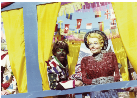
"La Florentina". Personatge creat pel Tonet de cal Ros cap a l'any 1935, fet amb vergelles d'avellaner i que, acompanyat del Garibaldi, s'exhibia amb el Carnestoltes durant els festes de Carnaval. En la foto rep la visita d'un arlequí.

Dilluns a la tarda sortien els contrabandistes. Uns quants nois passaven pels carrers, pels camins i pels camps amb un farcell a l'esquena. Eren perseguits pels arlequins fins que eren detinguts i portats a la plaça, on serien jutjats el mateix dia.